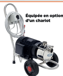
Équipée en option d'un chariot